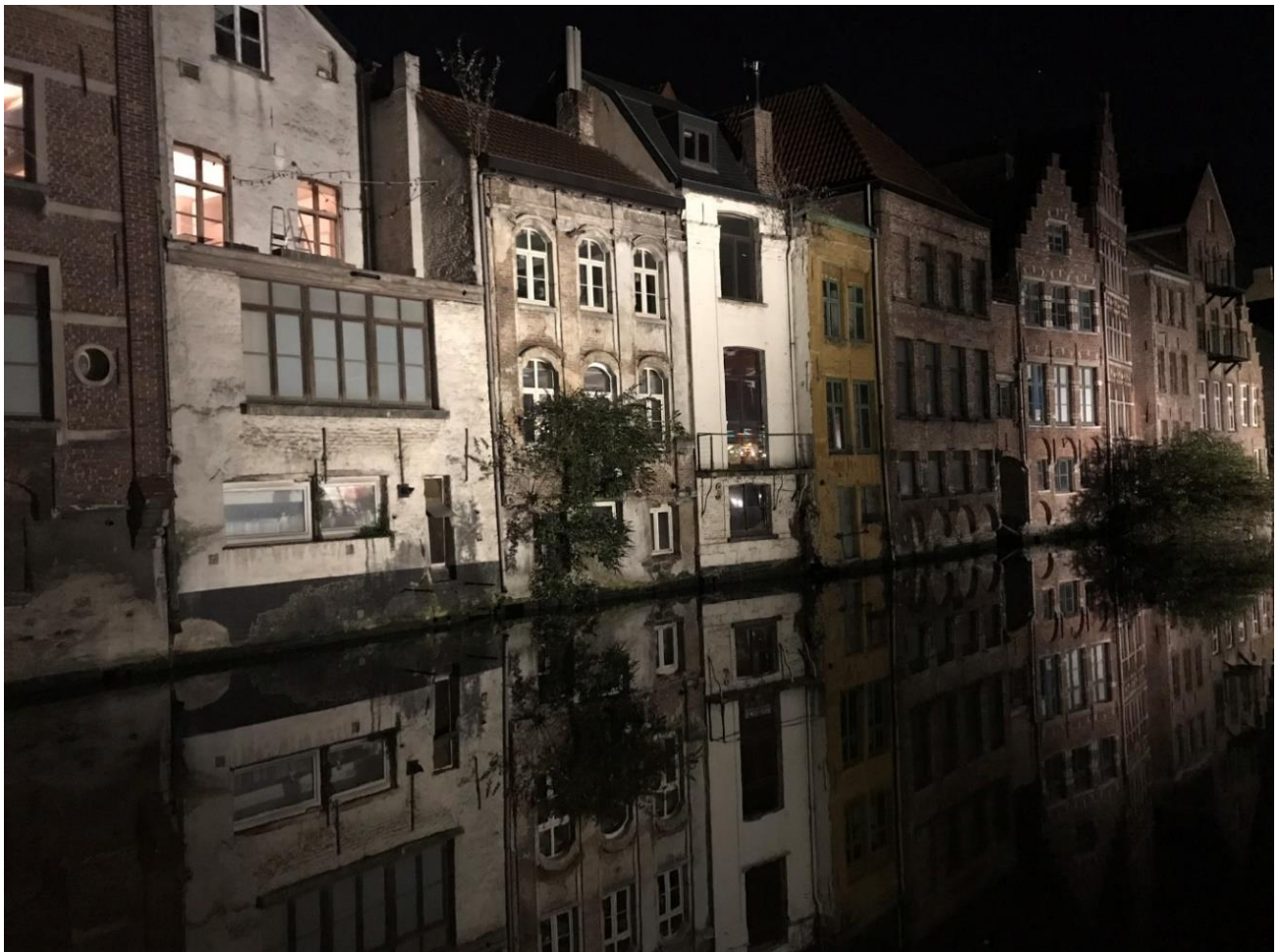
Gent bij nacht 2018